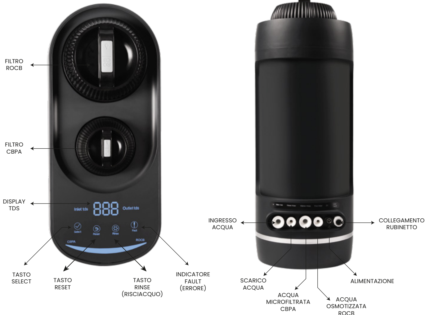
VISTA DEL RETRO