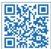
Video Cambio Filtro CF-CBPA