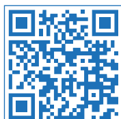
Video Cambio Membrana ROCB